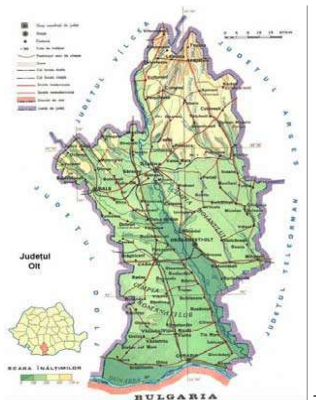
Figura 1: POZITIA GEOGRAFICA A PROIECTULUI

Judetul Olt se afla situat in Regiunea de dezvoltare 4 Sud-Vest Oltenia. Din punct de vedere administrativ, judetul Olt este compus din 2 municipii (Slatina si Caracal), 6 orase (Bals, Corabia, Draganesti Olt, Piatra Olt, Potcoava si Scornicesti) si 104 comune.