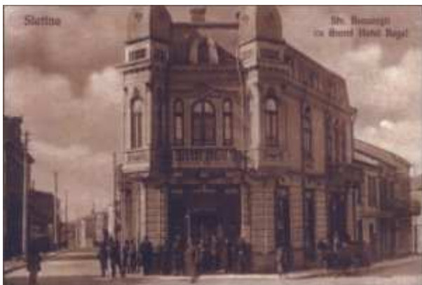
Slatina - Strada București