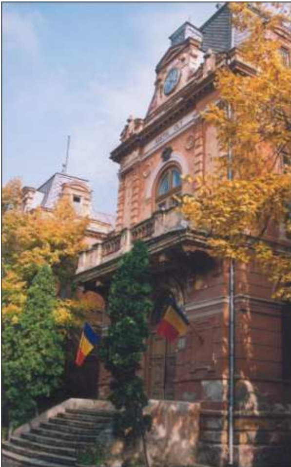
Muzeul Judetean de Istorie si Arta Olt

Viața culturală a județului Olt s-a dezvoltat în ultimii ani antrenând și valorificând talentele locuitorilor în diferite domenii : artă plastică, muzică, teatru, pictură, literatură, poezie.