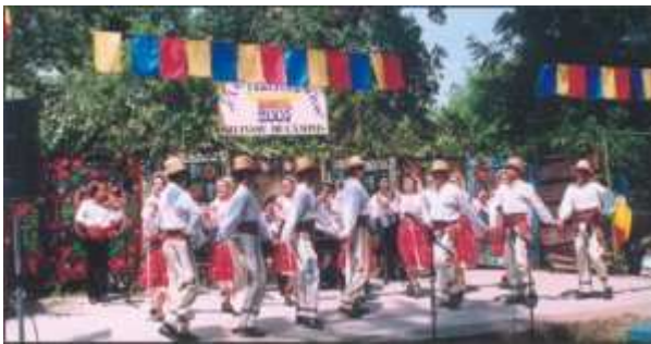
Ansamblul Folcloric Profesionalist 'Plaiurile Oltului'