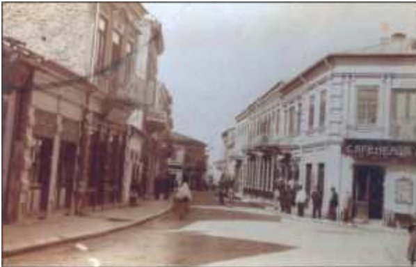
Slatina - Strada Lipscani

Anul 1491 pare a fi după unele surse indirecte prima atestare a Mănăstirii Brâncoveni, trei ani mai târziu ea existând din plin. Pentru a nu se pierde amintirea mai veche a lui Matei Basarab, Brâncoveanu zideste din temelie în afara incintei o bolniță (1700-1702), care păstrează chipurile originale ale ctitorilor și ale lui Matei Basarab.