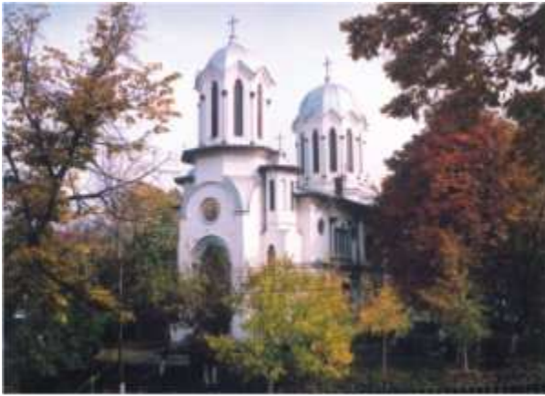
Catedrala Ortodoxa Slatina

Arhitectura tezaurizează mărturii de o excepțională valoare artistică a culturii materiale și spirituale a poporului român. Mănăstirile din județul Olt constituie o parte importantă a unui inventar al patrimoniului arhitectural. Acestea se remarcă prin originalitatea organizării spațiului și bogăția decoratiei.