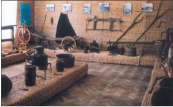
Interior muzeul din Fragnetelu